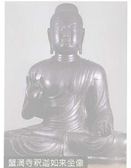
蟹満寺釈迦如来坐像

●荒天時、道路状況等により遅延、中止する場合もございます。●昭和41年製の車両の為、冷暖房は快適ではありません。●ボンネットバスは1台のため車両トラブル等により運行できない場合は代替車両を使用させていただきますので、ご理解・了承くださいますようお願いいたします。