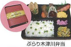
ぶらり木津川弁当