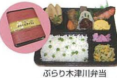
ぶらり木津川弁当