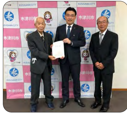
木津川市長要望活動