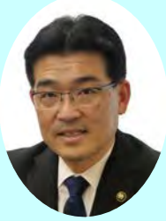
市長 本津川 雄一 谷口 雄一