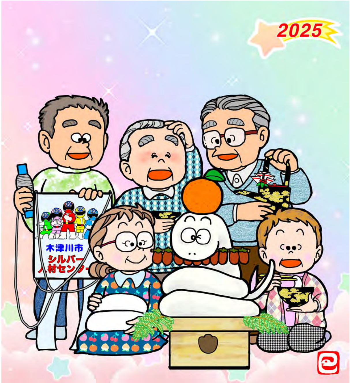
イラスト 山本春代会員