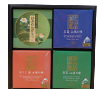
お茶とお菓子セット