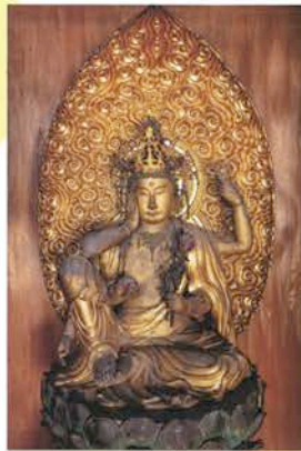
秘仏・如意輪観音菩薩像